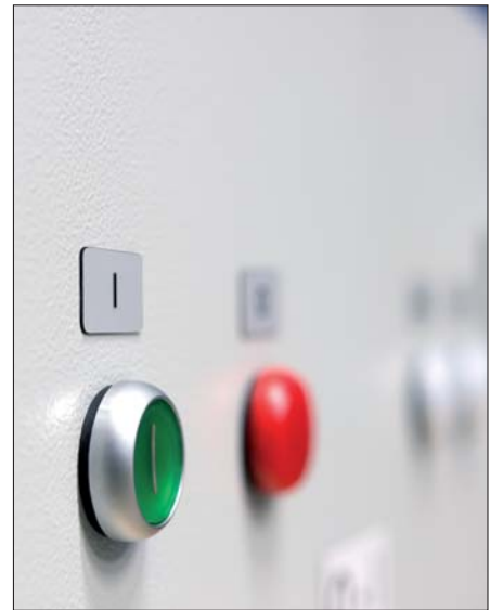
Idealer Ersatz für gravierte Schilder: Panel-Etiketten.